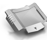
Kühlerverkleidung für MT-125 ohne ABS